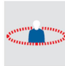
Einschränkung im Bewegungsradius