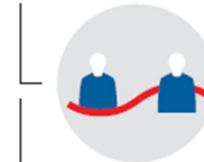
Ein- und Ausgrenzung