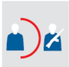
Fernhaltung vom terroristischen Umfeld