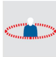
Einschränkung im Bewegungsradius