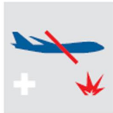
Hinderung an Reisen in ein Konfliktgebiet