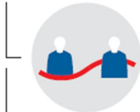
Ein- und Ausgrenzung